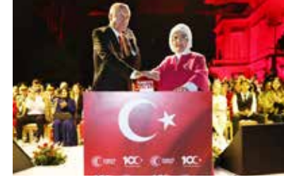
Cumhurbaşkanı Erdoğan, gösterileri eşi Emine Erdoğan ile birlikte izledi.

Farklı etkinliklerle bu önemli yıl dönümünün hak ettiği şekilde kutlanmasını sağlayan tüm kişi ve kurumlara teşekkür eden Cumhurbaşkanı Erdoğan, Cumhuriyet'in 100'üncü yılını bir kez daha kutladı. Cumhurbaşkanı Erdoğan, hitabının ardından, Cumhurbaşkanlığı İletişim Başkanlığı'nca Cumhuriyet'in 100'üncü yılına özel etkinlikler kapsamında İstanbul Boğazi'nde düzenlenen drone, havai fişek ve ışık gösterilerini başlatmak üzere butona bastı.