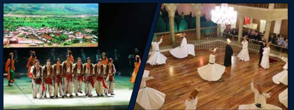
Konferanslara katılım sağlayan konuklar için Devlet Halk Dansları Topluluğu tarafından kültürümüzün zenginliğini yansıtan muhteşem bir gösteri sergilendi. Ayrıca İstanbul'un sembolik mekânlarından Yenikapı Mevlevihanesi'nde düzenlenen sema gösterisi katılımcılara unutulmaz anlar yaşattı.