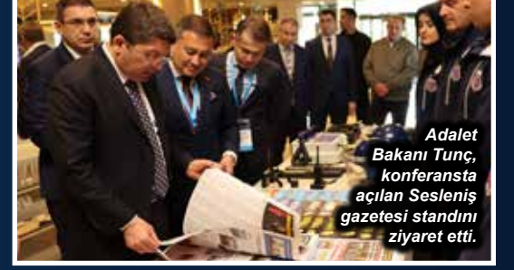
Adalet Bakanı Tunç, konferansta açılan Sesleniş gazetesini ziyaret etti.