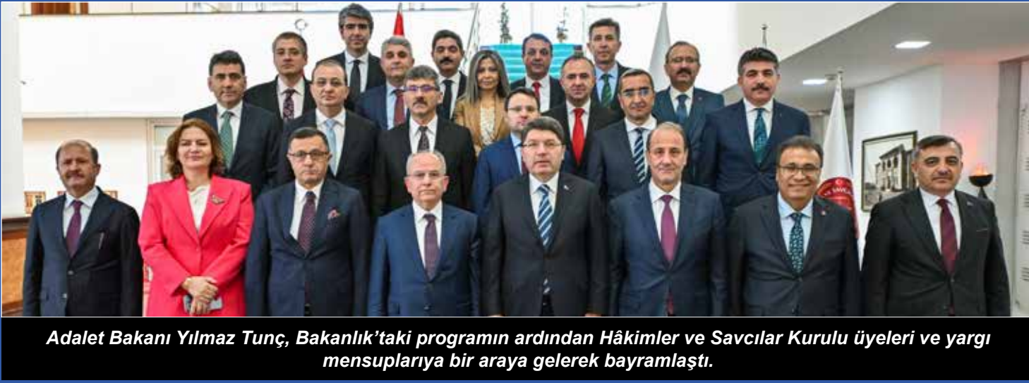
Adalet Bakanı Yılmaz Tunç, Bakanlık'taki programın ardından Hâkimler ve Savcılar Kurulu üyeleri ve yargı mensuplarına bir araya gelerek bayramlaştı.

A DALET Bakanlığında Ramazan Bayramı sebebiyle bayramlaşma töreni gerçekleştirildi. Adalet Bakanlığında bayramlaşma töreninde Adalet Bakanı Yılmaz Tunç, bakanlık personeli ile tek tek bayramlaşarak geçmiş Ramazan Bayramı'nı tebrik etti. Bayramlaşma programına Adalet Bakan Yardımcıları Ramazan Can, Akın Gürlek, Hürşit Yıldırım ve Niyazi Acar da katıldı.