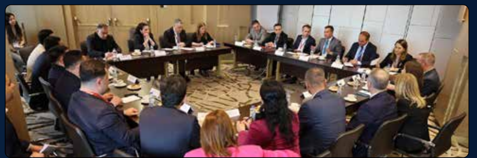
Genel Müdür Yıldırım, Ceza İnfaz Kurumlarında Teknoloji Konferansı'nın ikinci gününde, Türk ve bölge devletlerinin temsilcileriyle bir araya geldi. Ceza infaz sistemlerindeki iş birliklerinin ele alındığı toplantıda, karşılıklı görüşmeler gerçekleştirildi.