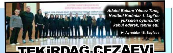
Adalet Bakanı Yılmaz Tunç, Hentbol Kadınlar 1. Ligi'ne yükselen oyuncularını kabul ederek, tebrik etti. ► Ayrıntılar 16. Sayfada

■ Ramazan ayının manevi atmosferi, çeşitli ceza infaz kurumlarında iftar programlarıyla yaşandı. Eskişehir'den Samsun'a, Kocaeli'den Muğla'ya kadar birçok şehirde düzenlenen iftar programlarında, valiler, başsavcılar, yargı temsilcileri ve kurum personeli bir araya geldi. Programlar, Kur'an-ı Kerim tilaveti, ilahi dinletisi ve ödül törenleri gibi etkinliklerle renklendi. ► 8'de