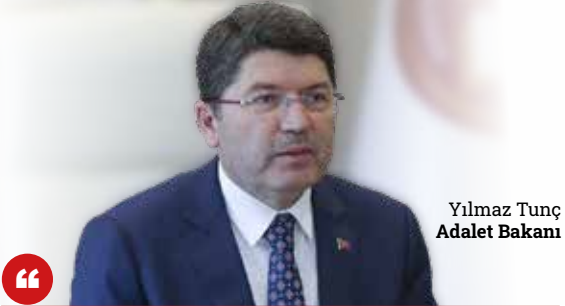
Yılmaz Tunç Adalet Bakanı

■ Cumhurbaşkanı Erdoğan, ülke genelinde düzenledikleri çeşitli programlarla bu günü tarihteki yerine uygun bir şekilde idrak ettiklerini, Türkiye'nin dört bir yanında 15 Temmuz'u, şehitleri andıklarını, onları unutmaya-caklarını ve unutturmayacaklarını vurguladı. ► 2-3'te