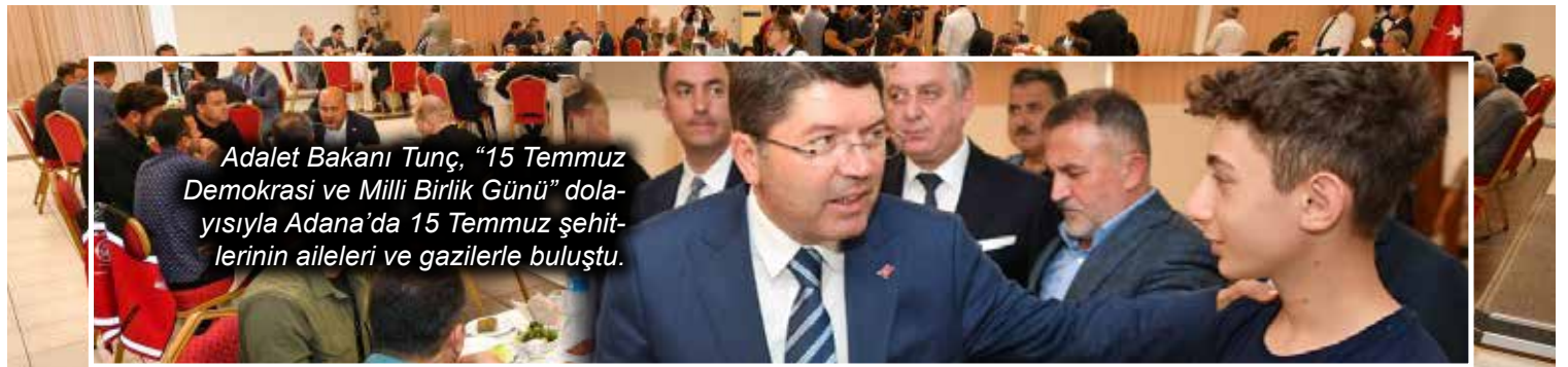
Adalet Bakanı Tunç, "15 Temmuz Demokrasi ve Millî Birlik Günü" dolayısıyla Adana'da 15 Temmuz şehitlerinin aileleri ve gazilerle buluştu.

■ Adalet Bakanı Yılmaz Tunç, 15 Temmuz darbe girişimi sırasında yaşadıklarını ve FETÖ ile mücadeleyi Anadolu Ajansı'na anlattı. Tunç, "Darbe kalkışmasının önlenmesinde en önemli unsurlardan birisi de yargının mücadelesiydi. Yargı gerçekten o gece çok önemli ve başarılı bir sınav verdi. Adeta yargımız o gece kahramanlık gösterdi." dedi. ► 6. Sayfada