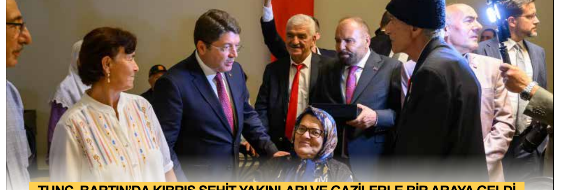
TUNÇ, BARTIN'DA KIBRIS ŞEHİT YAKINLARI VE GAZİLERLE BİR ARAYA GELDİ

söndürmesi gerektiğine inanıyoruz. Ülkemizin daha yakın tarihinde vicdanlarını kiraya verenlerin milletimize nasıl büyük acılar yaşattığını gayet iyi hatırlıyoruz. Akli ve muhakemeyi değerleştirip yerine ideolojiyi koyanların işlediği hukuk cinayetlerine 27 Mayıs'ta, 12 Eylül'de, 28 Şubat'ta şahit olduk. Partimize karşı açılan kapatma davasında aynı şekilde hukuksuzluğun ne demek olduğunu bizzat tecrübe ettik." Cumhurbaşkanı Erdoğan, şunları kaydetti: "Yargıyı tahakküm aracı olarak kullananların gerçek yüzünü önce 17-25 Aralık'ta ardından 15 Temmuz'da hep birlikte gördük. Tüm bu acı tecrübelerden gerekli dersleri çıkardık. Türkiye'yi bir daha asla bu tür sınamalarla karşı karşıya bırakmamakta kararlıyız. Her türlü vesayetle sonuna kadar mücadele edecek, devlet organlarının millî iradenin kapsama alanının dışına çıkmasına izin vermeyeceğiz. Hukukun üstünlüğü ilkesi yerine üstünlerin hukukunu geri getirmeye çalışanlara müsaade etmedik, etmeyeceğiz. İnşallah bunu da sizlerle birlikte başaracağız. Bu duygularla bir kez daha yeni adli yılın yargı ve hukuk camiamızın tüm tarafları için hayırlara vesile olmasını diliyorum. Türkiye'nin dört bir yanında adaletin tecellisine hizmet eden hâkimlerimize, savcılarımıza, avukatlarımıza, yargı çalışanlarımıza kolaylıklar diliyorum." Törene, Adalet Bakanı Yılmaz Tunç ile yüksek yargı organları üyeleri de katıldı.