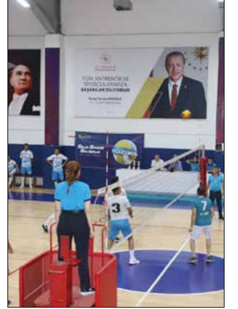
Afyonkarahisar'da Pickleball Turnuvası

T ÜRKİYE genelindeki ceza infaz kurumları ve denetimli serbestlik müdürlüklerinde düzenlenen spor etkinlikleri, hükümlülerin sosyalleşmesi ve rehabilitasyonu açısından büyük önem taşıyor. Son günlerde gerçekleştirilen çeşitli spor turnuvaları, bu amaca hizmet ederken aynı zamanda katılımcılara motivasyon sağlıyor.