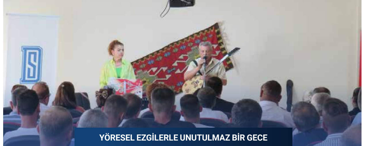
YÖRESEL EZGİLERLE UNUTULMAZ BİR GECE

Adalet Bakanlığı olarak bağımlılıkla mücadelede toplumun her kesimiyle iş birliği içinde faaliyetlerimizi sürdürmekte ve bireylerin topluma kazandırılmasına yönelik çalışmalara öncülük etmekteyiz. Bağımlı bireylerin rehabilitasyonu ve topluma yeniden kazandırılması sürecinde yürütülen denetimli serbestlik uygulamaları, uyuşturucu madde kullanımının önlenmesine yönelik uzun vadeli bir stratejinin parçasıdır. Bu kapsamda atılan her adım, toplumumuzun geleceği için büyük bir kazanım olarak değerlendirilmelidir. Ünlü yazar Grigory Petrov'un da söylediği gibi "Bağımlılıklardan uzak durun. Her çeşit bağımlılık, ruhsal kölelik getirir. Kimseye ve hiçbir şeye köle olmayın."