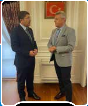
Bakan Tunç, gazeteci Ersoy Dede'nin sorularını yanıtladı.

■ İnfaz kanununda bugüne kadar çok sayıda değişiklik yapıldığını hatırlatan Adalet Bakanı Tunç, cezasızlık algısını ortadan kaldırmaya yönelik çalışmalarını daha önce de açıkladıklarını dile getirdi. Bakan Tunç, hükümlülerin topluma kazandırılmasının önemli olduğunu belirtti.