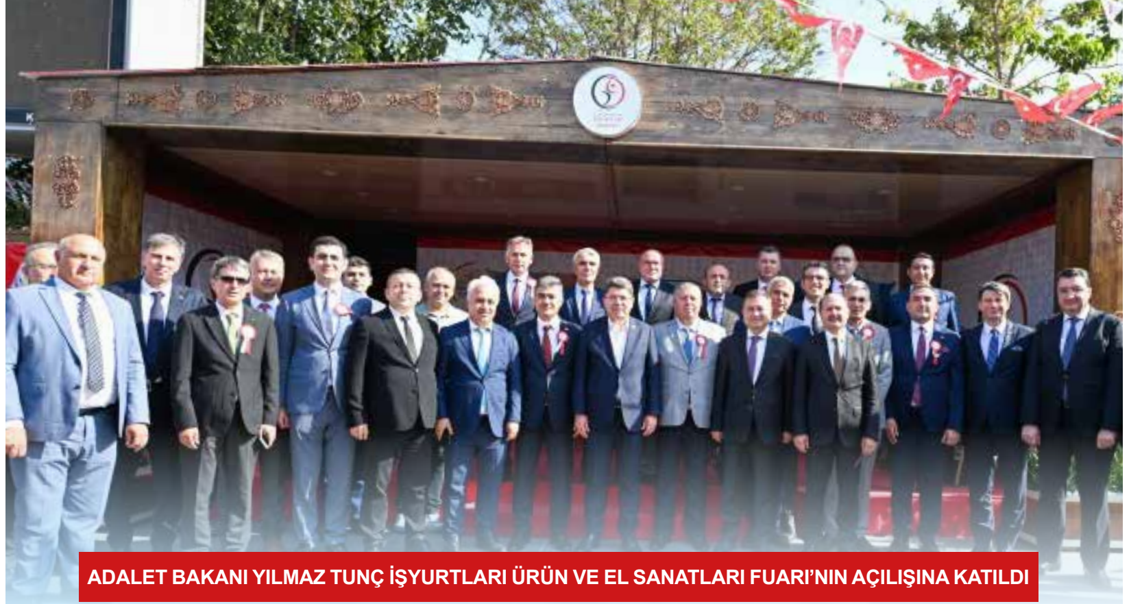
ADALET BAKANI YILMAZ TUNÇ İŞYUURLARI ÜRÜN VE EL SANATLARI FUARI'NIN AÇILIŞINA KATILDI

Ceza infaz kurumlarının faaliyetleri, Adalet Bakanlığı Müfettişleri, Cumhuriyet Savcıları ve bağımsız insan hakları kuruluşları tarafından düzenli olarak denetlenmektedir. Bu denetimler, kurumların yasalara ve insan haklarına uygun olarak işletilmesini sağlamayı amaçlamakta ve ceza infaz kurumu personelinin daha fazla insan hakları ve etik değerler konusunda daha hassas olmalarını sağlamaktadır.